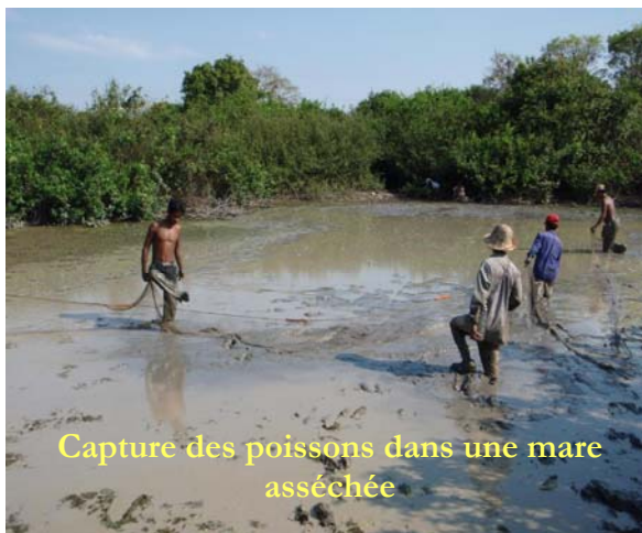
Capture des poissons dans une mare asséchée

Plonger dans le milieu des patrons de pêches, vendant les droits d'exploitation des rivières et mares, était le second obstacle attendu. Fonctionnement totalement opaque, mares non cartographiées et sans noms, valeurs et prix invérifiables, négociations sibyllines... En fin de compte, 12 mares proches de deux colonies d'oiseaux furent achetées pour le (très large) budget prévu la première année... et, l'expérience comptant, 39 mares pour deux tiers de ce montant l'année suivante !!