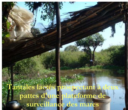
Tantales lactés prospectant à deux pattes d'une plateforme de surveillance des mares

Malheureusement, les quantités de poissons trouvées dans les mares la première année étaient insignifiantes, et infiniment inférieures à la valeur d'achat, laissant fortement suspecter à la fois un prix largement surfait ainsi qu'un braconnage des mares. La seconde année, les prises furent plus importantes dans les mares exploitées (mais toujours bien en-deçà de la valeur d'achat), alors qu'une sécheresse exceptionnelle asséchait toutes les mares protégées avant l'opération de pêche.