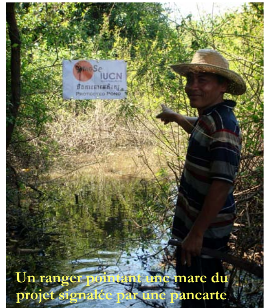
Un ranger pointant une mare du projet signalée par une pancarte

En août 2008, l'UICN Pays-Bas approuvait le financement d'un projet de conservation soumis par Osmose, pour 53.788 euros. L'étude pilote visait à évaluer l'impact de la protection d'une série de mares sur les stocks de poissons et le succès de reproduction des oiseaux dans l'aire protégée de Prek Toal. Elle consistait en fait à tester un outil de gestion de la zone qui serait bénéfique à la fois aux pêcheries et à la conservation, et le démontrer scientifiquement pour soutenir une réforme de la concession de pêche, appelée 'Lot de pêche'. Le projet fut coordonné par Grégory Duplant, jeune biologiste français, détaché auprès d'Osmose par France Volontaires .