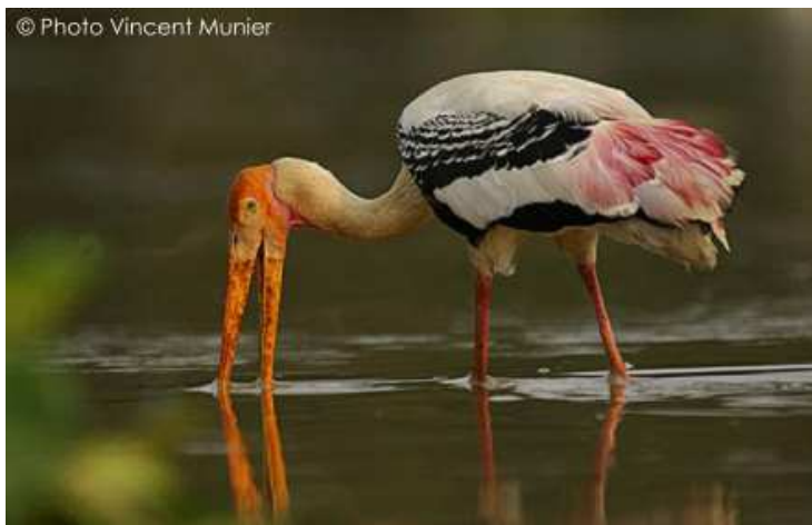
Le tantale indien, une des espèces menacées dont Prek Toal héberge la plus grande colonie d'Asie du Sud-Est

L'équipe d'anciens braconniers et villageois devenus les gardiens des oiseaux peut être fière de son travail. Toutes les espèces menacées pour lesquelles, rappelons-le, Prek Toal est le dernier refuge en Asie du Sud-Est, sont en progression. Au bord de l'extinction en 2001, les effectifs d'Anhingas dépassent les 5000 couples aujourd'hui, alors que ceux des autres espèces (pélicans, ibis, marabouts, tantes) se rétablissent moins spectaculairement mais significativement. Phil Round, l'expert des oiseaux de Thaïlande, n'en croit pas ses jumelles : ces espèces qu'il avait vu s'éteindre, repeuplent peu à peu les cieux siamois durant la mousson, lorsqu'ils se dispersent hors du lac.